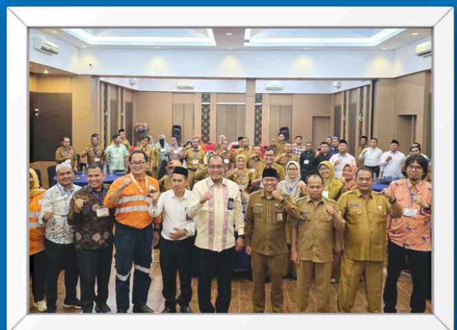
Kerjasama dengan PT. Agincourt Resources dalam Kegiatan Peningkatan Kompetensi GTK