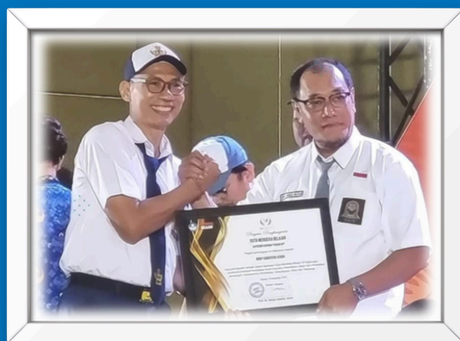
Apresiasi sebagai Duta Merdeka Belajar 2023 dari Kemendikbudristek