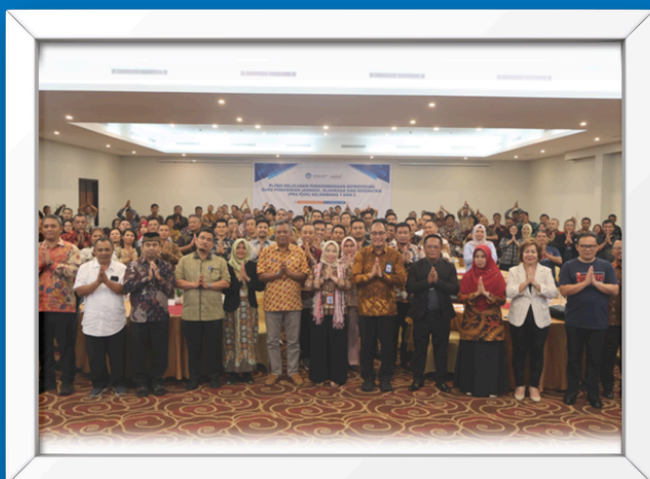
Rakor dan Evaluasi Program Pengembangan dan Pemberdayaan GTK Bersama dengan Disdik Prov/Kota/Kab se Sumatera Utara