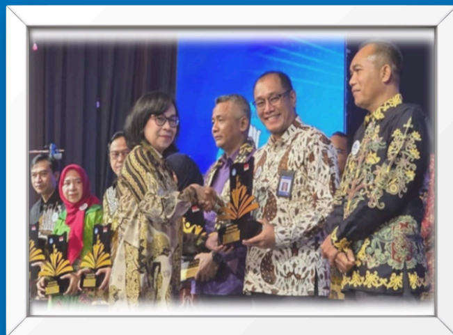
Apresiasi Kategori Dampak Advokasi dan Fasilitas UPT Inspiratif 2024 dari Kemendikbudristek