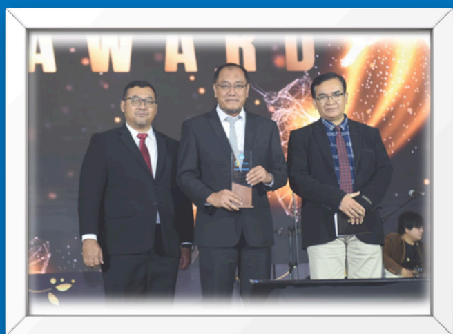
Apresiasi sebagai Kepala UPT Terkreatif 2023 dalam Program LDP Kemendikbudristek