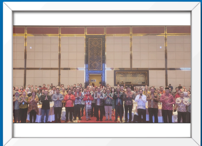
Rapat Pembentukan Konsorsium Pendidikan Daerah (KPD) Bersama dengan Dirjen GTK dan Pemangku Kepentingan di Sumatera Utara (Disdik Prov/Kota/Kab, LLDIKTI, BKN, BKD/BKPSDM, BKAD, Perguruan Tinggi, UPT Kemendikdasmen dan mitra lainnya)