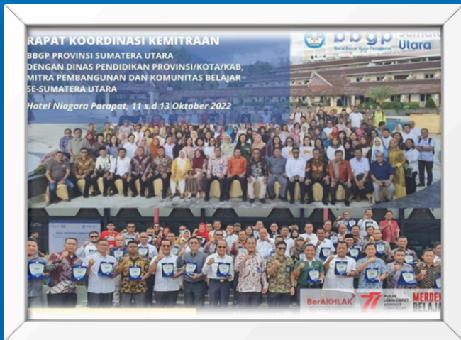
Rakor Kemitraan dengan Disdik Provinsi/Kota/Kab dan Mitra lainnya di Sumatera Utara