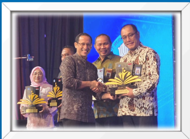
Apresiasi Kategori Utama UPT Inspiratif 2024 dari Menteri Pendidikan, Kebudayaan, Riset dan Teknologi